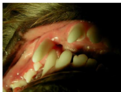
Rückbiss mit Fangzahnstand

Brusttiefe: Der Brustkorb sollte an seiner tiefsten Stelle bis zum Ellenbogen reichen. Geschlechtsspezifische Unterschiede sind natürlich hier nicht außer Acht zu lassen.